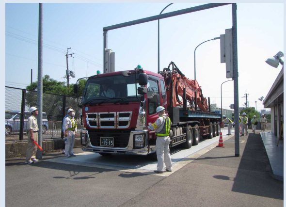
業務履行状況（特殊車両指導取締補助）